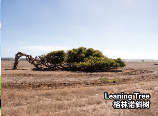
Leaning Tree 格林诺斜树