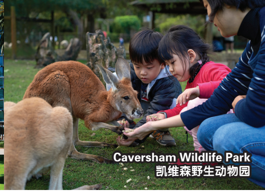
Caversham Wildlife Park 凱維森野生動物園