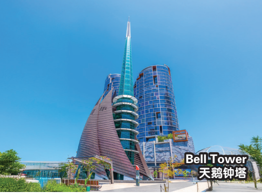
Bell Tower 天鵝鐘塔