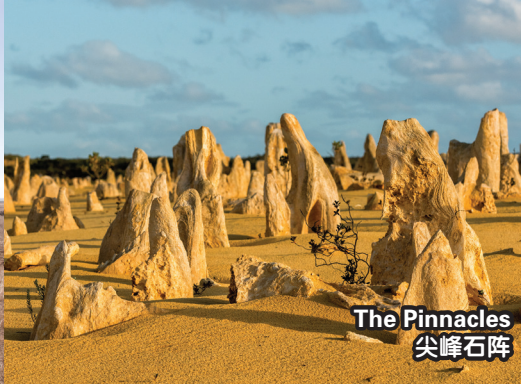
The Pinnacles 尖峰石阵