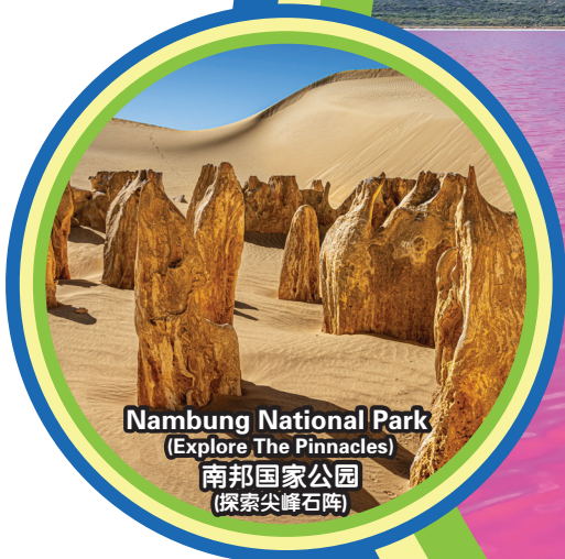
Nambung National Park (Explore The Pinnacles) 南邦国家公园 (探索尖峰石阵)