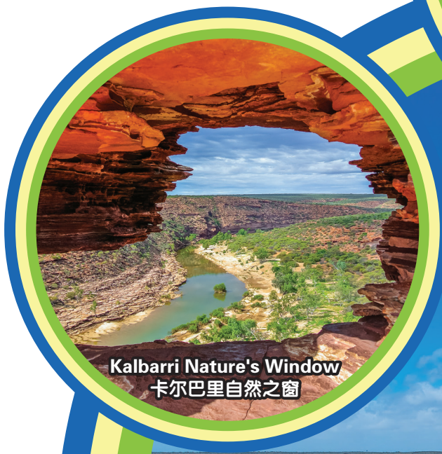
Kalbarri Nature's Window 卡尔巴里自然之窗