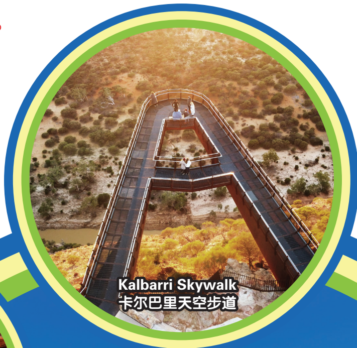
Kalbarri Skywalk 卡尔巴里天空步道