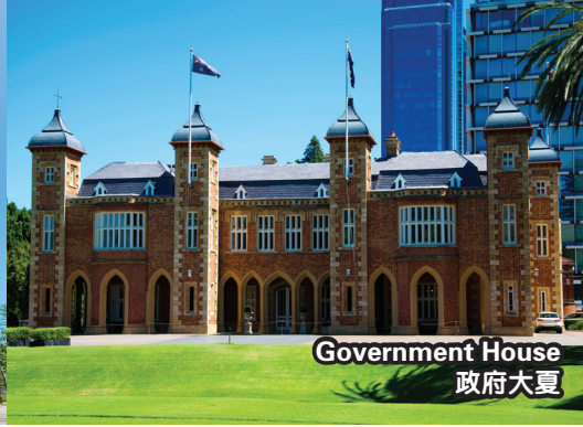
Government House 政府大夏