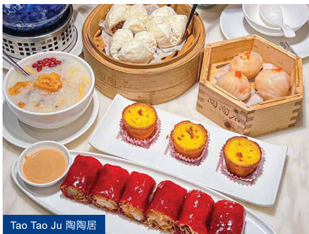
Tao Tao Ju 陶陶居