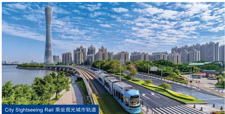
City Sightseeing Rail 乘坐观光城市轨道