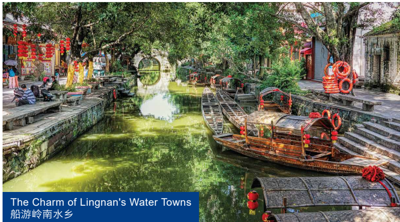
The Charm of Lingnan's Water Towns 船游岭南水乡

*Remarks: All photos in the itinerary are for illustration purpose only. *备注: 行程上的图片仅供参考。