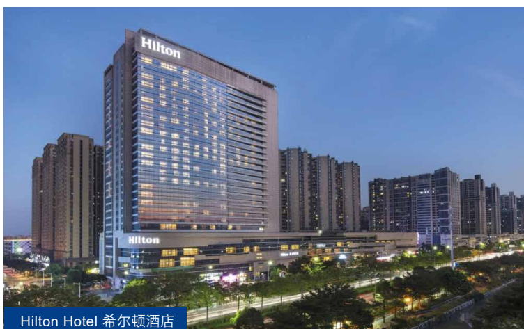
Hilton Hotel 希尔顿酒店