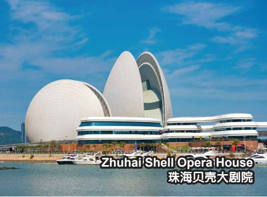
Zhuhai Shell Opera House 珠海贝壳大剧院