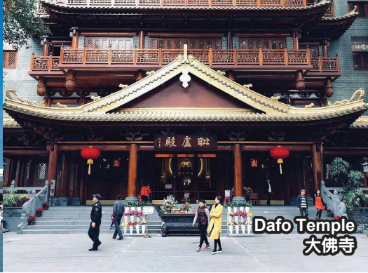
Dafo Temple 大佛寺