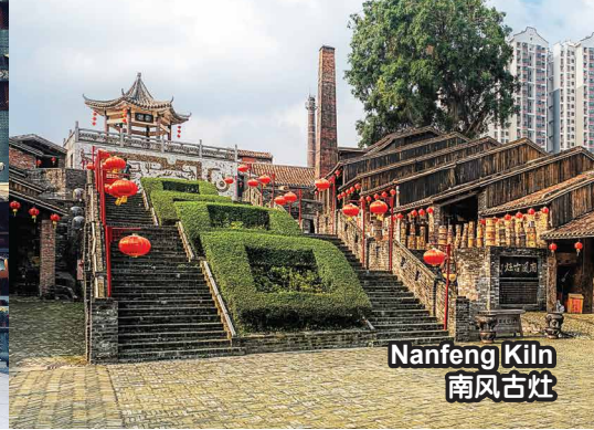
Nanfeng Kiln 南风古灶