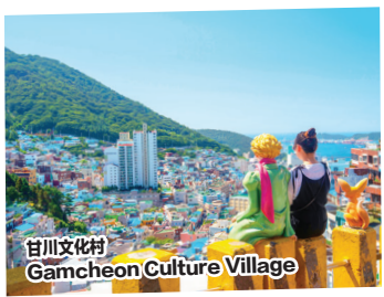
甘川文化村 Gamcheon Culture Village