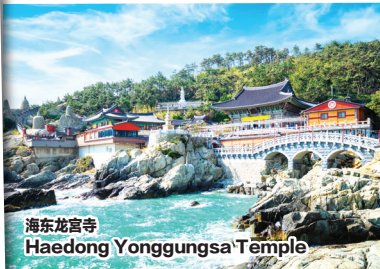
海东龙宫寺 Haedong Yonggungsa Temple