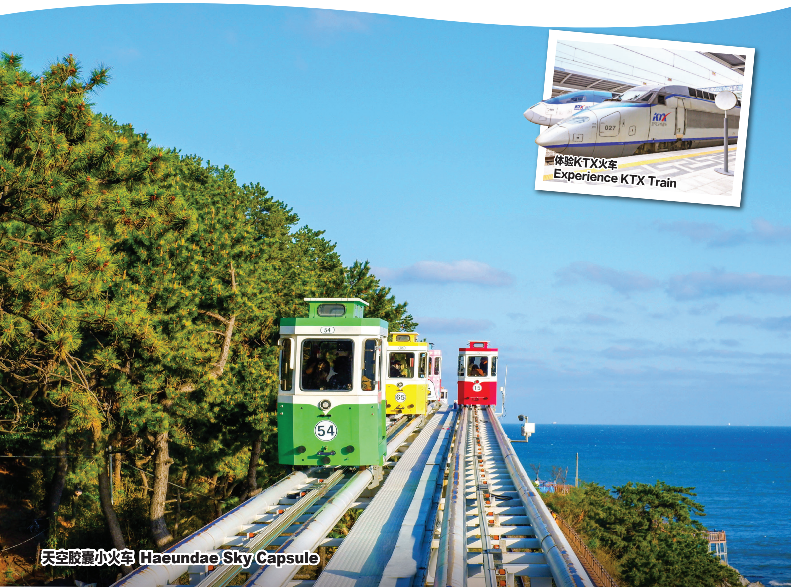
天空胶囊小火车 Haeundae Sky Capsule