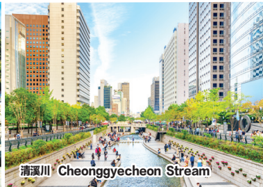
清溪川 Cheonggyecheon Stream