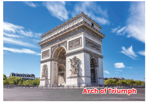
Arch of Triumph