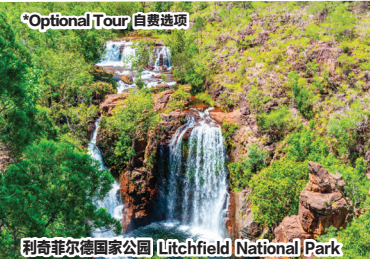
利奇菲尔德国家公园 Litchfield National Park