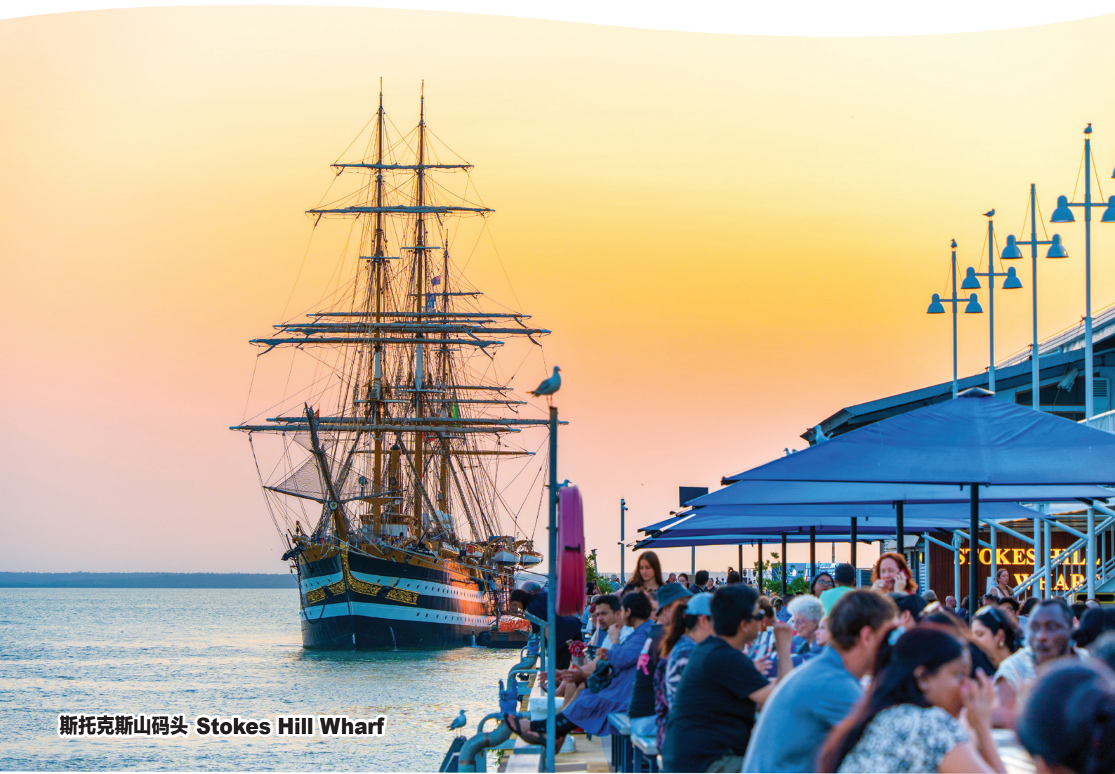
斯托克斯山码头 Stokes Hill Wharf