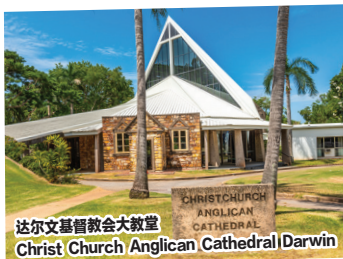
达尔文基督教会大教堂 Christ Church Anglican Cathedral Darwin