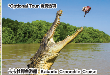
卡卡杜鳄鱼游船 Kakadu Crocodile Cruise