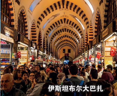
伊斯坦布尔大巴扎