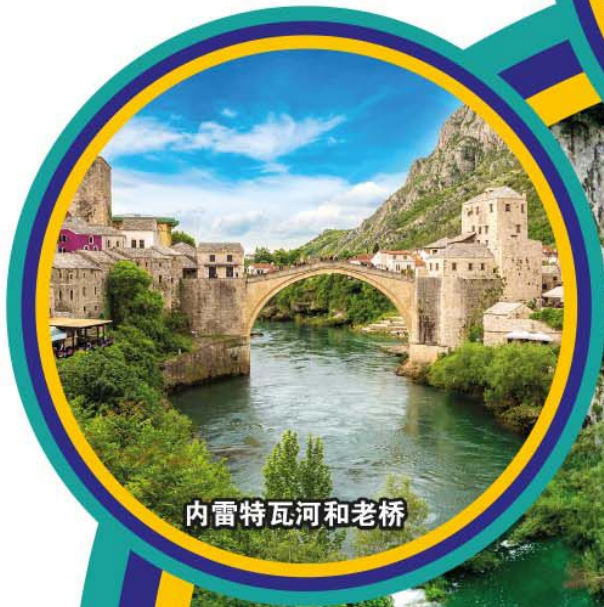
内雷特瓦河和老桥