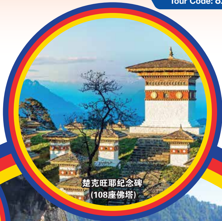
楚克旺耶纪念碑 (108座佛塔)