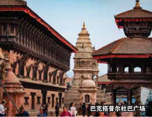
巴克塔普尔杜巴广场