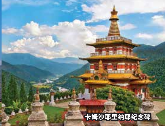
卡姆沙耶里纳耶纪念碑