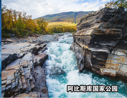
阿比斯库国家公园