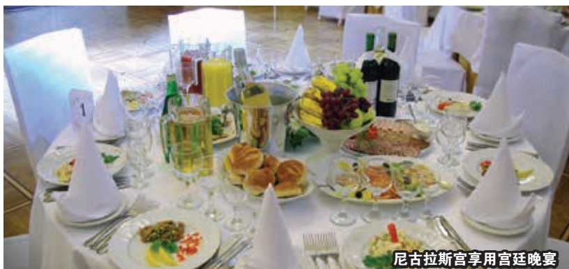
尼古拉斯宫享用宫廷晚宴