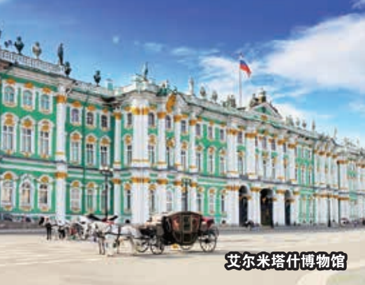
艾尔米塔什博物馆