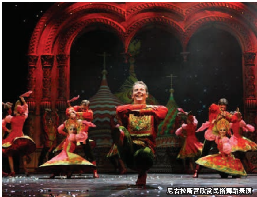
尼古拉斯宫欣赏民俗舞蹈表演