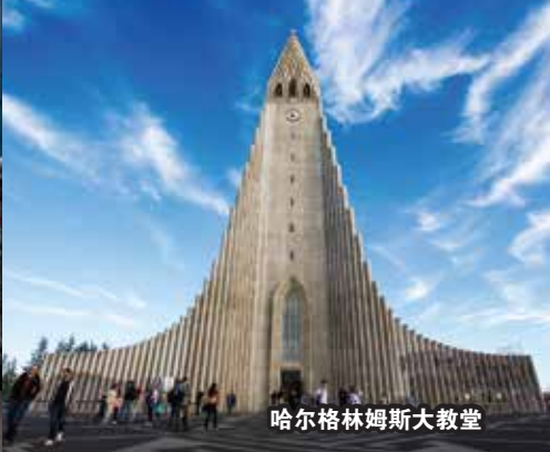
哈尔格林姆斯大教堂