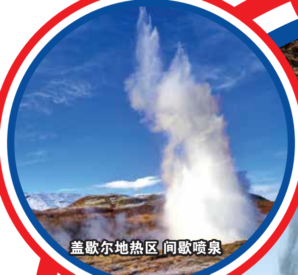
盖歇尔地热区 间歇喷泉