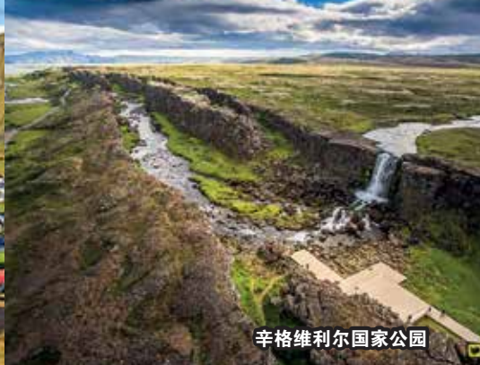
辛格维利尔国家公园