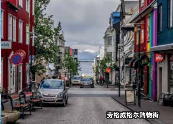
劳格威格尔购物街