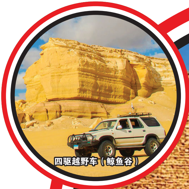
四驱越野车 (鲸鱼谷)