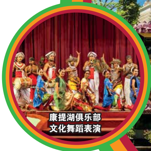
康提湖俱乐部 文化舞蹈表演