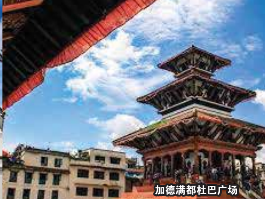
加德满都杜巴广场