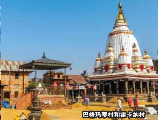
巴格玛蒂村和霍卡纳村