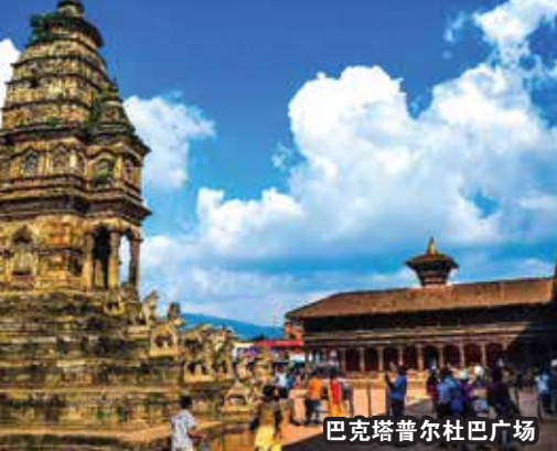
巴克塔普尔杜巴广场