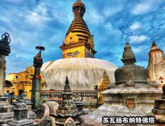
苏瓦扬布纳特佛塔