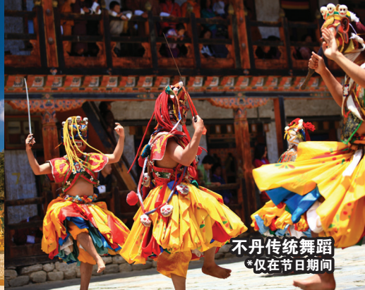
不丹传统舞蹈 *仅在节日期间