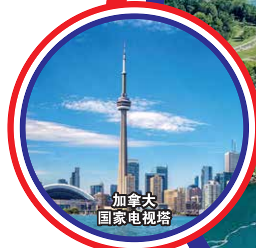
加拿大 国家电视塔