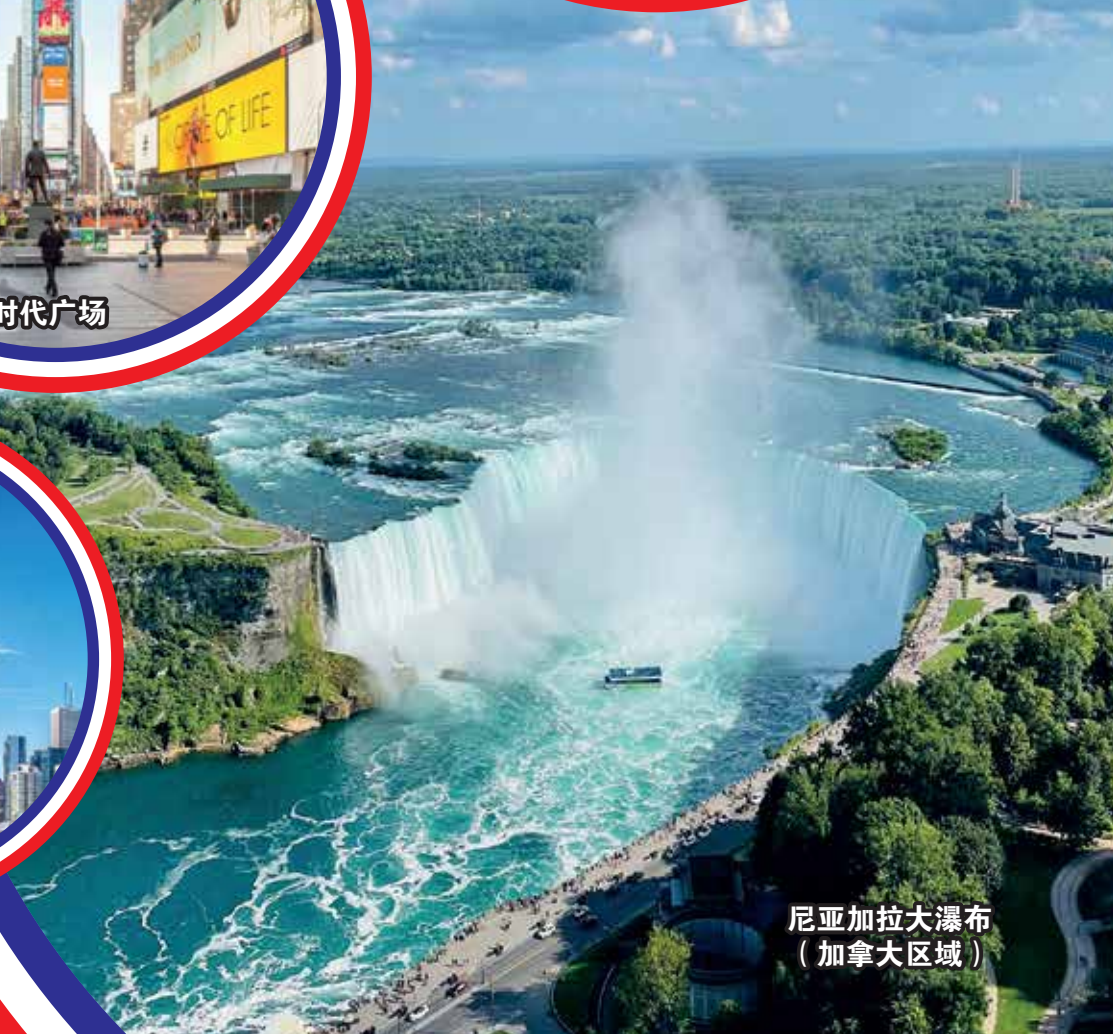
尼亚加拉大瀑布 (加拿大区域)