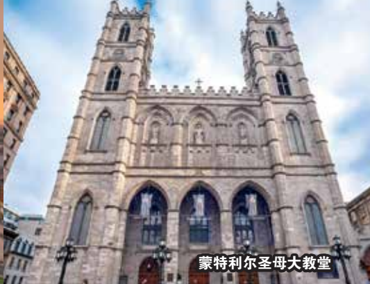
蒙特利尔圣母大教堂