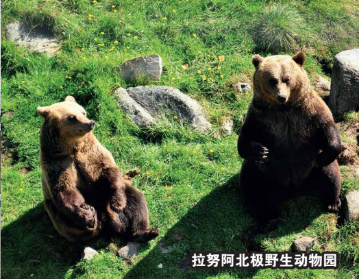
拉努阿北极野生动物园