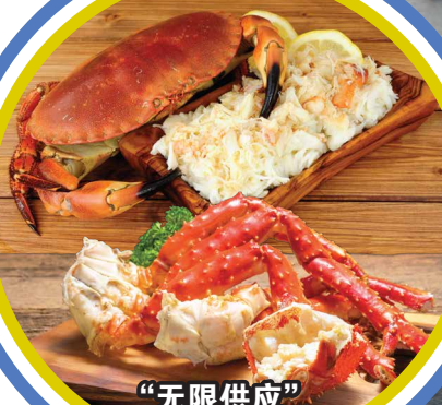
“无限供应” 面包蟹 & 帝王蟹