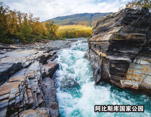
阿比斯库国家公园