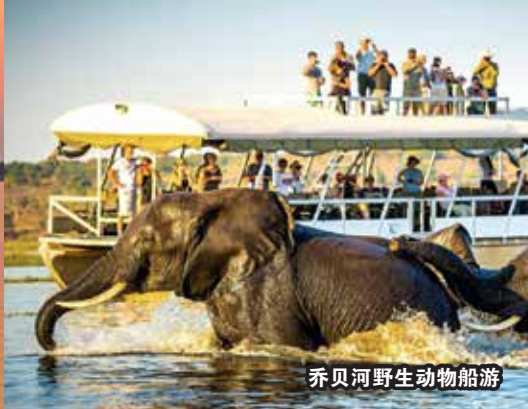
乔贝河野生动物船游