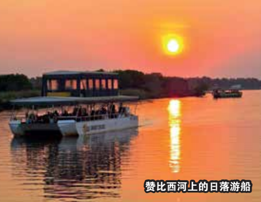
赞比西河上的日落游船