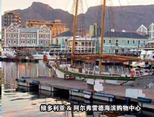
维多利亚 & 阿尔弗雷德海滨购物中心