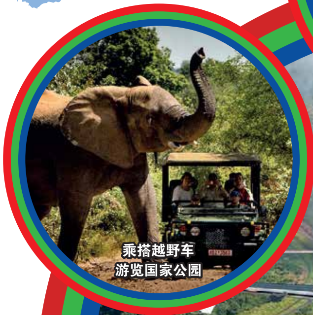
乘搭越野车 游览国家公园