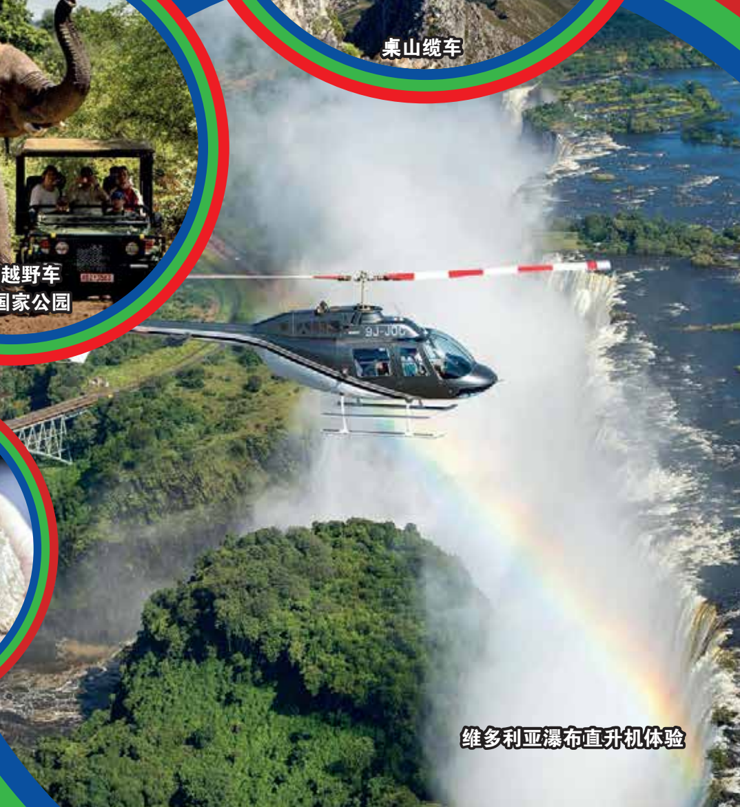
维多利亚瀑布直升机体验