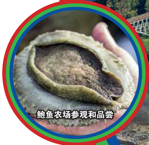
鲍鱼农场参观和品尝