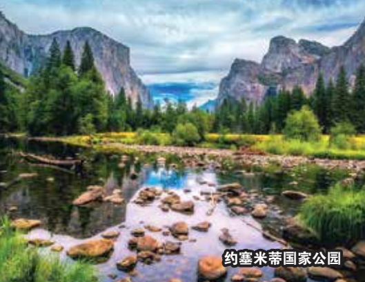
约塞米蒂国家公园