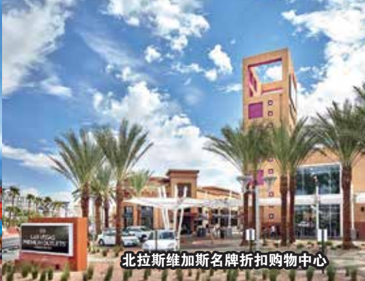
北拉斯维加斯名牌折扣购物中心