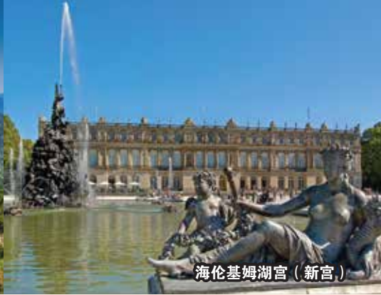
海伦基姆湖宫（新宫）