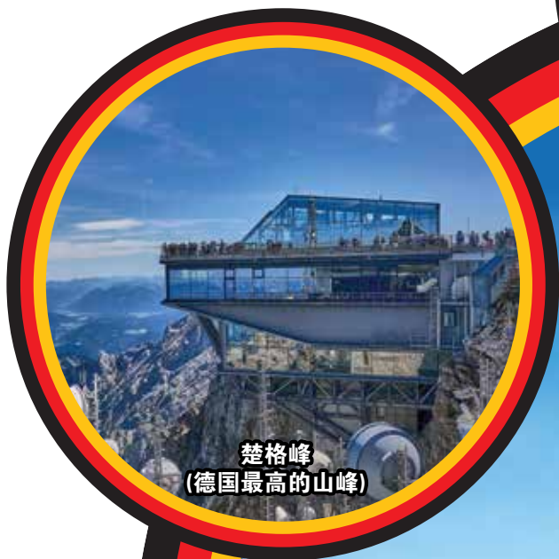
楚格峰 (德国最高的山峰)