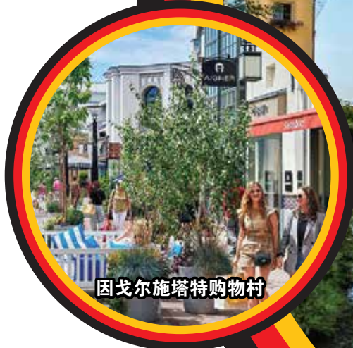
因戈尔施塔特购物村