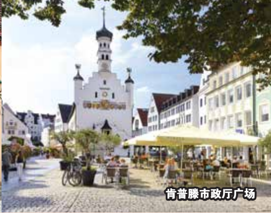
肯普滕市政厅广场