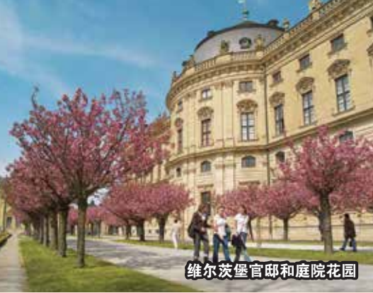
维尔茨堡官邸和庭院花园