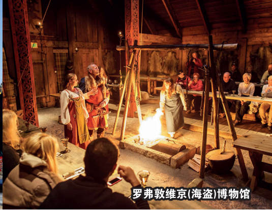
罗弗敦维京(海盗)博物馆