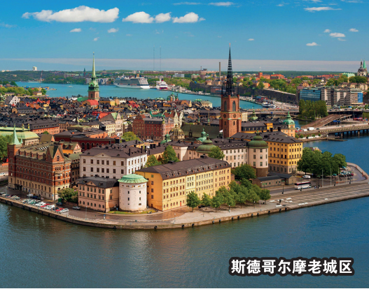
斯德哥尔摩老城区