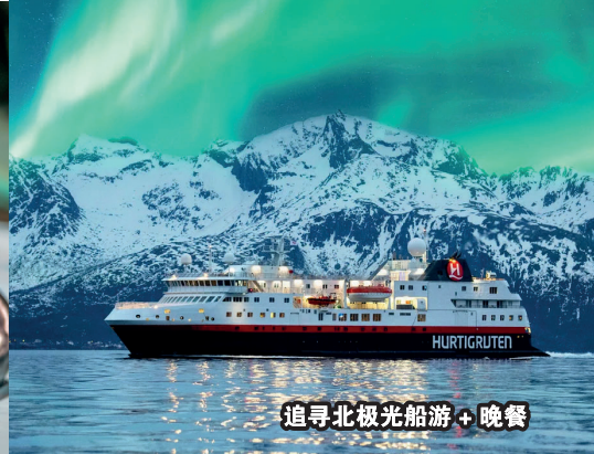
追寻北极光船游+晚餐