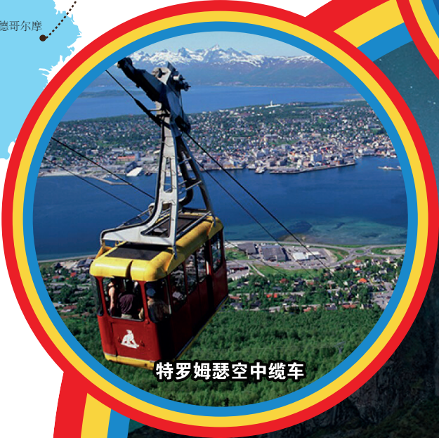
特罗姆瑟空中缆车