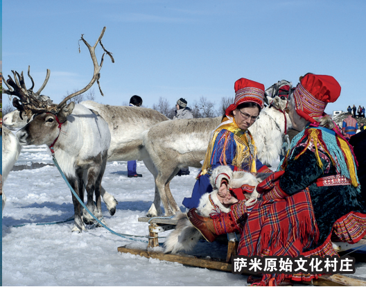
萨米原始文化村庄