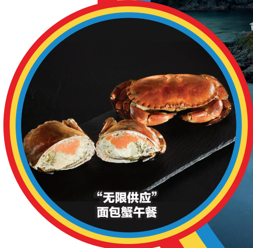
“无限供应” 面包蟹午餐