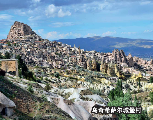
乌奇希萨尔城堡村