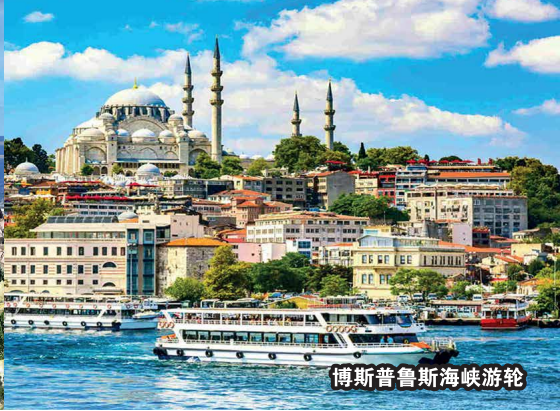
博斯普鲁斯海峡游轮