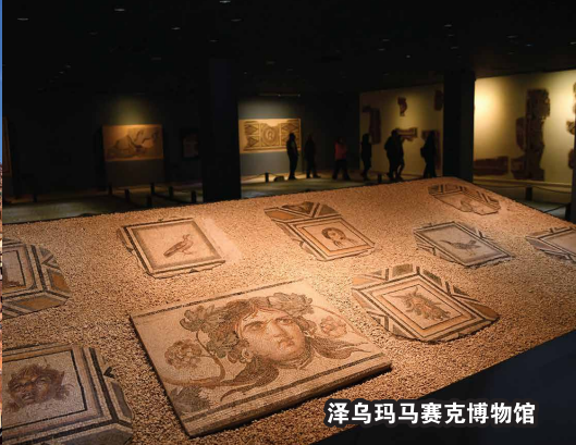
泽乌玛马赛克博物馆