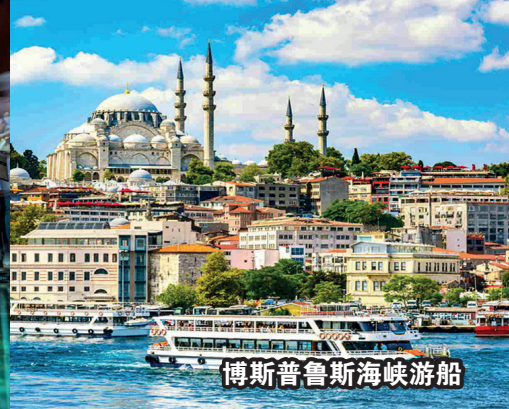
博斯普鲁斯海峡游船