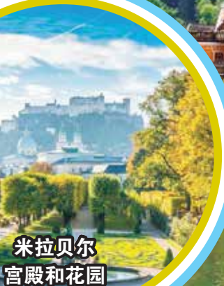
米拉贝尔 宫殿和花园