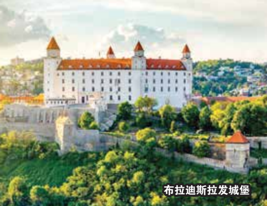
布拉迪斯拉发城堡