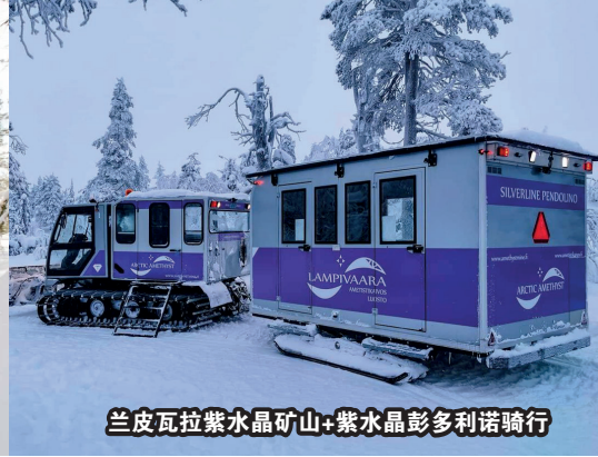
兰皮瓦拉紫水晶矿山+紫水晶彭多利诺骑行