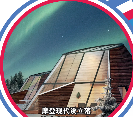
摩登现代设立落地玻璃别墅 (1晚)