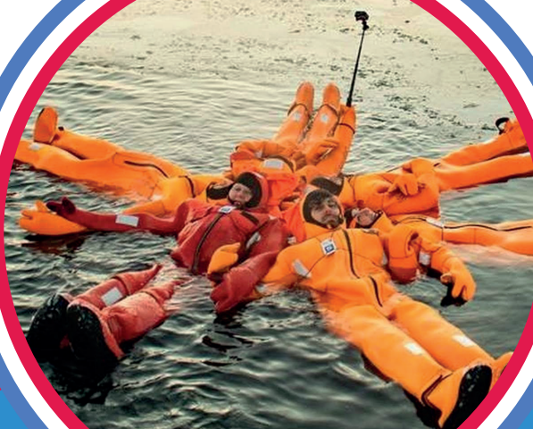
极地破冰之旅 (体验)