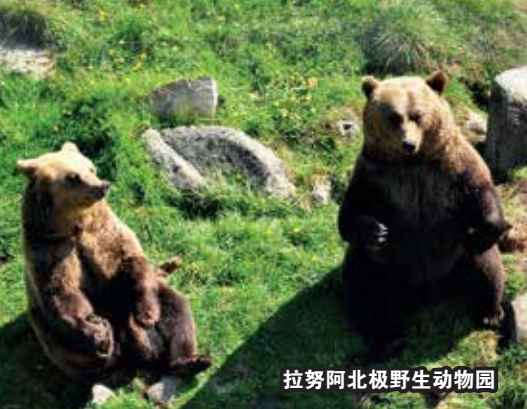
拉努阿北极野生动物园