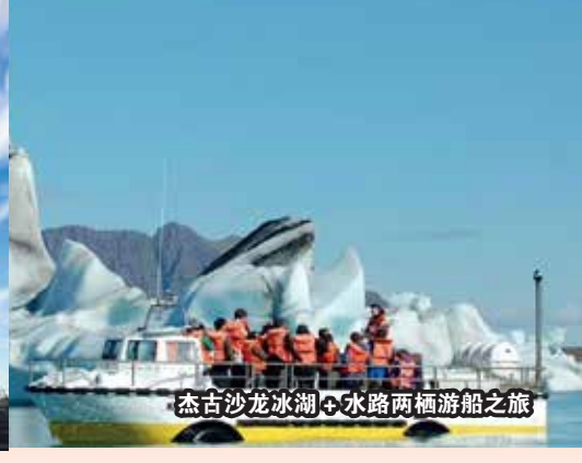
杰古沙龙冰湖 + 水路两栖游船之旅